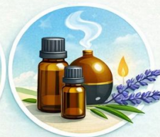
Huiles essentielles (en complément)